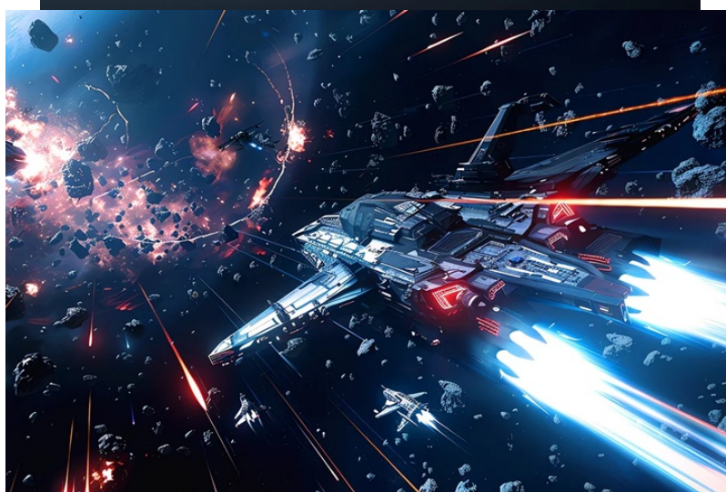
BenQ Mobiuz EX251