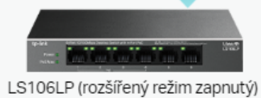
LS106LP (rozšířený režim zapnutý)