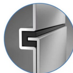
Sealed Lock-and-Key Design

Na zadní straně je k dispozici celá řada portů, mezi nimiž vyčnívá především rozhraní HDMI 2.0 , které zajistí snadné promítání 4K obsahu při vyšším jasu a kontrastu oproti standardnímu rozlišení. Jas je klíčem k viditelnosti. I proto nabízí projektor BenQ LU9245 funkci dynamického tlumení jasu dle scény a optimalizuje světelný výkon a kontrast pro co nejlepší obraz.